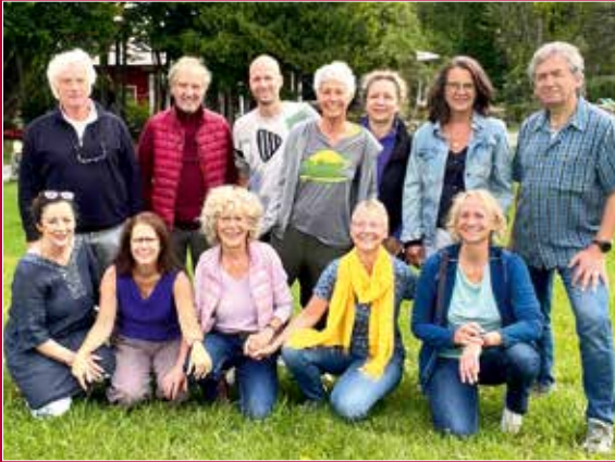
HAKOMI Lehrteamtreffen im Juli 23 in Bad Kohlgrub